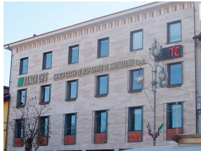
La vicenda alla Cassa di Risparmio dura già da un anno