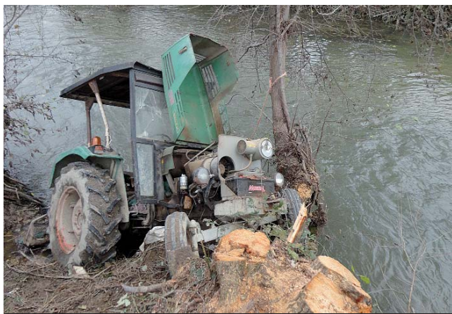
La scena dell'incidente - Servizio a pagina 23

Clamoroso colpo di scena nella vicenda della CRS