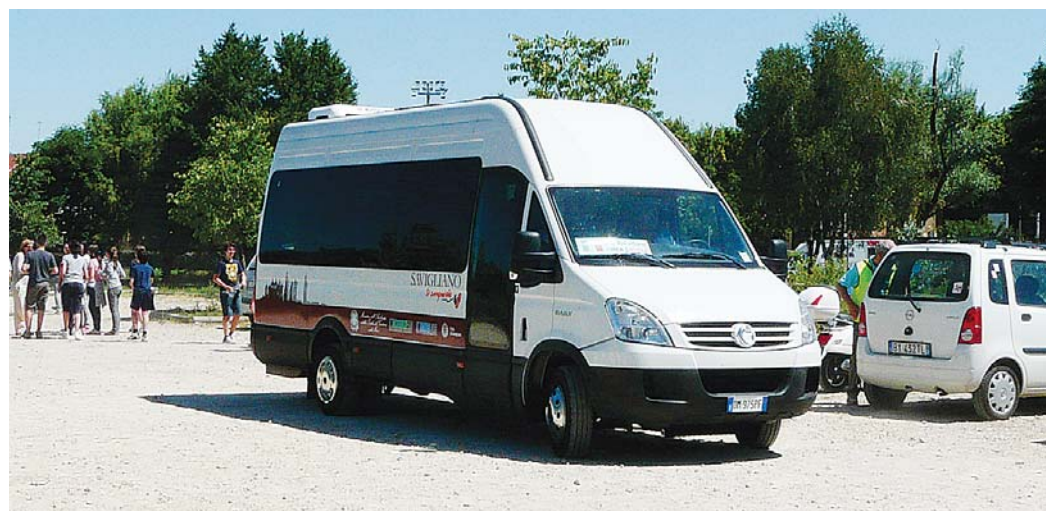
La "linea rossa" inaugurata un anno fa copriva la città da Est a Ovest. Era finanziata dal ministero