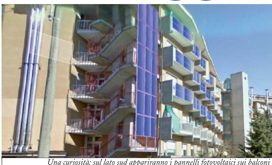
Una curiosità: sul lato sud appariranno i pannelli fotovoltaici sui balconi

Va avanti la realizzazione del progetto di "salvataggio" dalla casa di riposo Chianoc, che prevede numerosi interventi.