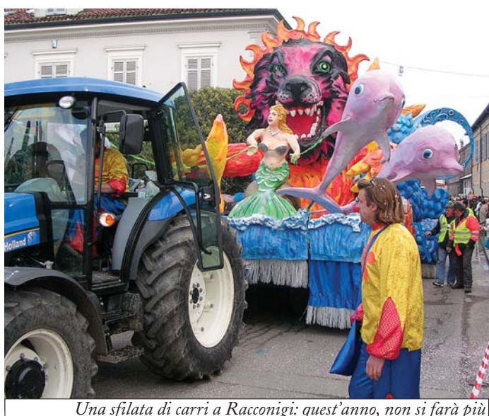
Una sfilata di carri a Raconigi: quest'anno, non si farà più

Carnevale di Raconigi Quest'anno niente sfilata