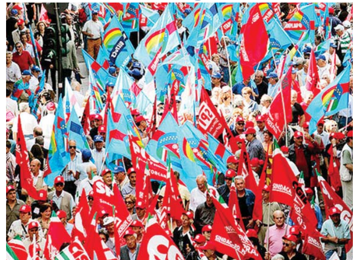
Bandiere dei sindacati Cgil, Cisl e Uil durante una manifestazione

Carnevale di Raconigi Quest'anno niente sfilata