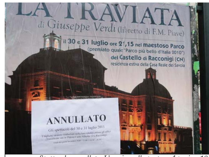
Spettacolo annullato. L'avviso sulla porta - A pagina 18