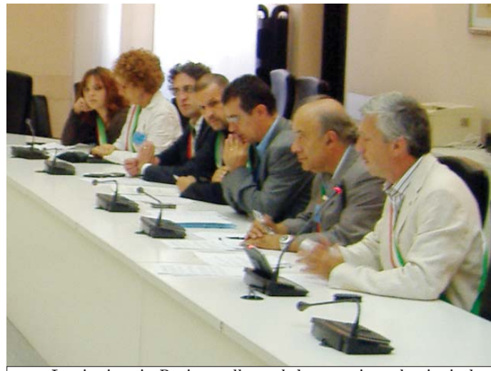
La riunione in Regione, alla quale ha partecipato la vicesindaco