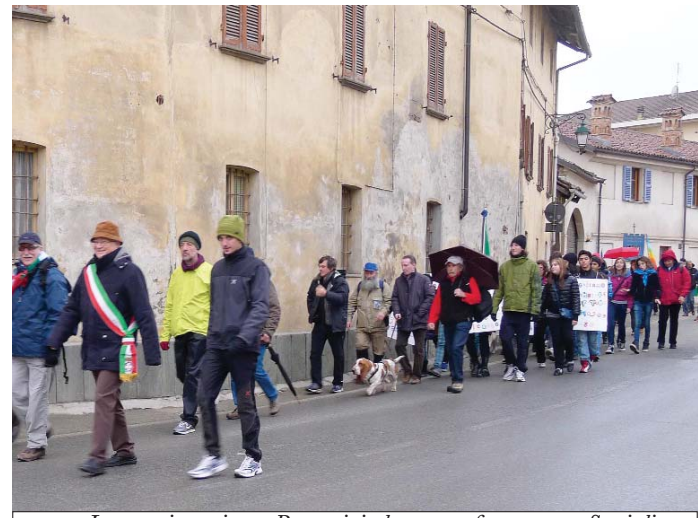
La marcia arriva a Racconigi, dopo aver fatto sosta a Savigliano