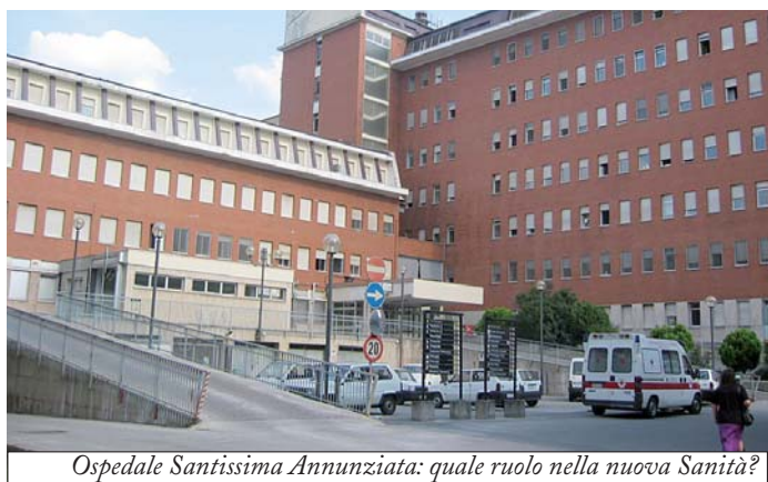
Ospedale Santissima Annunziata: quale ruolo nella nuova Sanità?