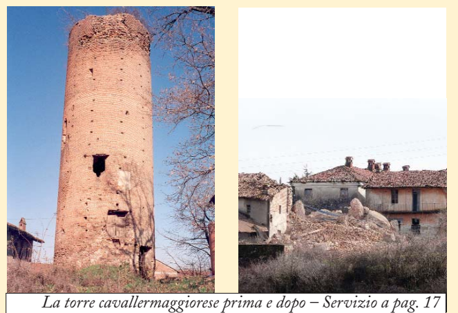
La torre cavallermaggiorese prima e dopo - Servizio a pag. 17