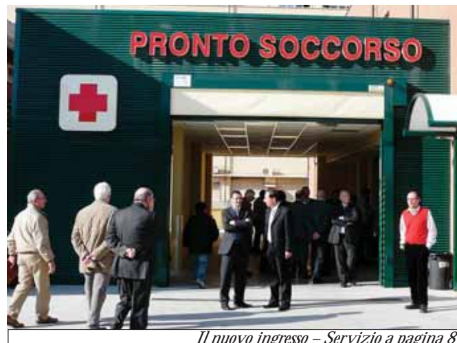
Il nuovo ingresso - Servizio a pagina 8