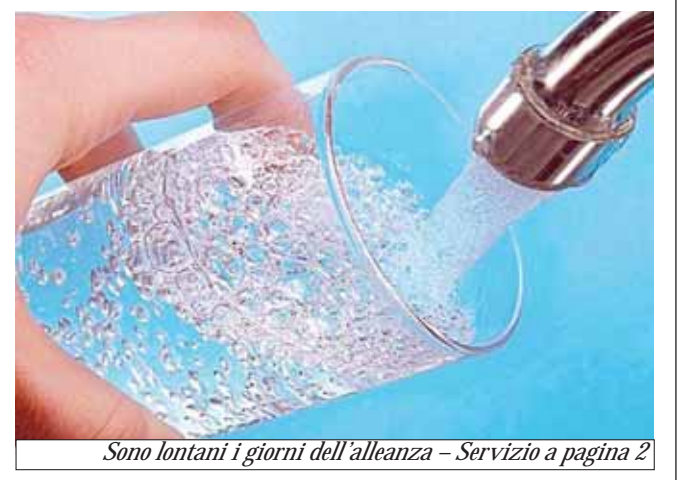
Sono lontani i giorni dell'alleanza - Servizio a pagina 2