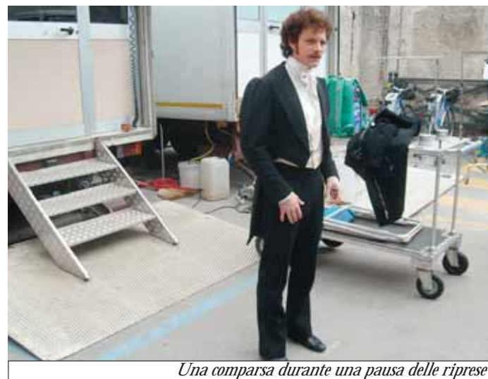
Una comparsa durante una pausa delle riprese

Chi martedì e mercoledì si è recato in piazza Turletti per assistere alle riprese del nuovo film di Mario Martone, "Noi Credevamo", è rimasto deluso: le molte star che stanno partecipando alle riprese sono rimaste chiuse nel teatro Milanollo per blindatissimi ciak.