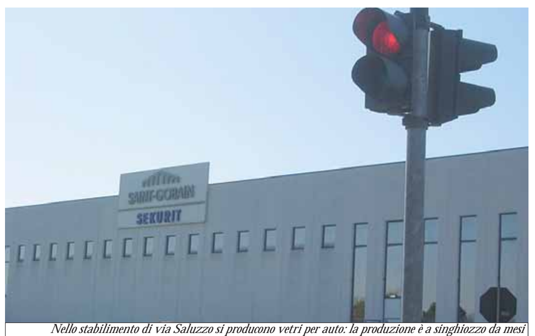
Nello stabilimento di via Saluzzo si producono vetri per auto: la produzione è a singhiozzo da mesi

"Il Molo" attacca la politica del Comune Servizio a pagina 5