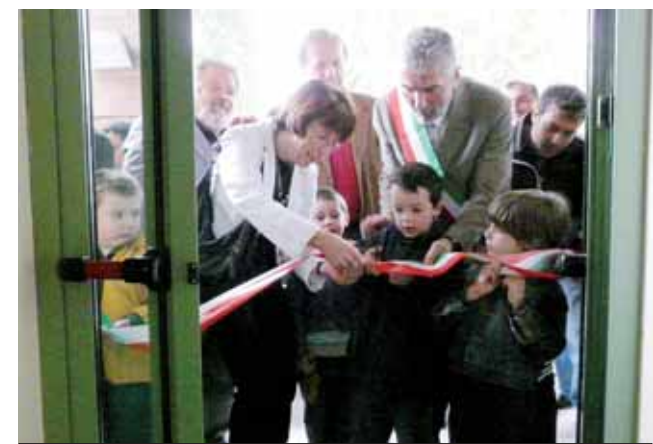
Il taglio del nastro - Servizio a pagina 17